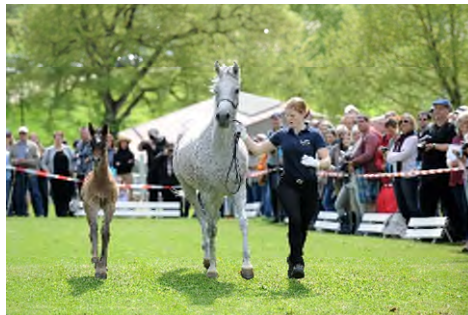
Vorstellung der Marbacher Vollblutaraberstuten und ihren Fohlen aus dem Jahrgang 2022