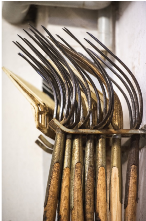
Gestütsalltag: Ordnung ist das halbe Leben

Wer ein Andenken an das Gestüt mit nach Hause bringen möchte, stattet dem Gestüts-Shop im Treffpunkt Marbach einen Besuch ab. Geschenkideen für Kinder, handgefertigte Produkte aus Manufakturen und einzigartige, regionale Produkte sind im Angebot des Gestüts-Shops. Während der baden-württembergischen Ferien hat der Shop täglich von 10 bis 17 Uhr geöffnet, außerhalb der Ferienzeit an Sonn- und Feiertagen 10-17 Uhr (April-Okt).