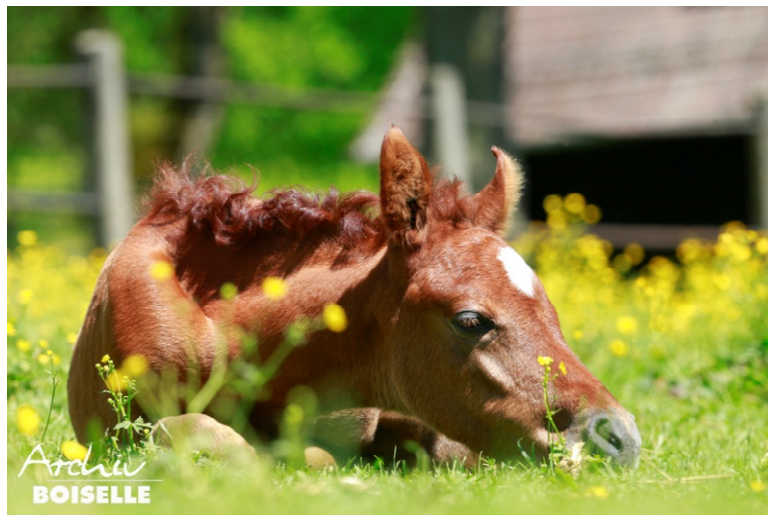
Kleine Pause gefällig: Vollblutaraberfohlen auf der Weide

„Pferdekindergarten“, ist um 10.30 Uhr am Stutenbrunnen im Innenhof des Gestütshofs Marbach. Eine Anmeldung ist per E-Mail an: info@hul.bwl.de oder telefonisch unter der Telefonnummer: (0 73 85) 96 95-037 erforderlich. Der Preis beträgt 6,00 Euro für Erwachsene und 3,00 Euro für Kinder. Mitglieder des Kinderclubs „Julmonds-Marbach“ bekommen eine Ermäßigung von 0,50 Euro. Bei dieser Führung gilt die AlbCard nicht.